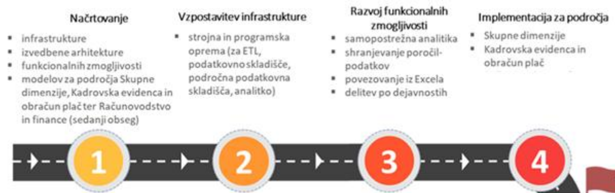
Slika 2: Časovni zemljevid razvoja centralnega sistema BI

Na sliki 2 je shematično prikazano zaporedje izvajanja aktivnosti, pri čemer je potrebno upoštevati možno prekrivanje ali vzporedno izvajanje posameznih aktivnosti.